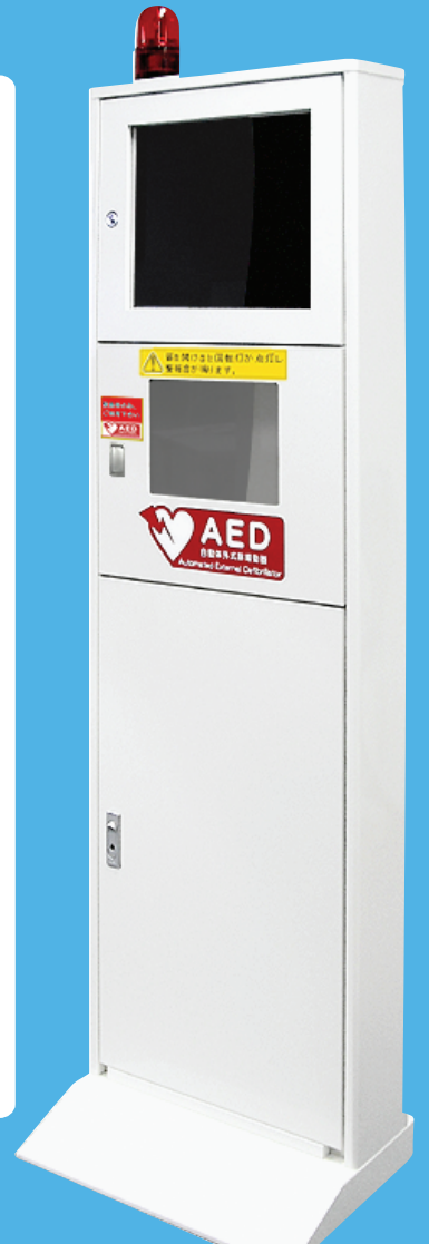
画像はイメージです。